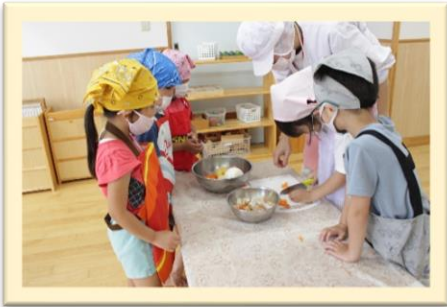
エプロン姿で、 はいチーズ！！