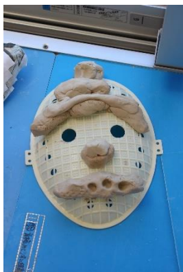
粘土で顔の土台を作る。

これは、和紙→新聞紙→画用紙の順で小さな紙片を何重にも重ねていく張子の面で、とても時間と根気を必要とする作業です。今年もどんな鬼にするのか、自分の中で鬼をイメージして絵を描き、粘土で土台を作りました。子どもたちも一生懸命、作業しているので完成を楽しみにしてください。