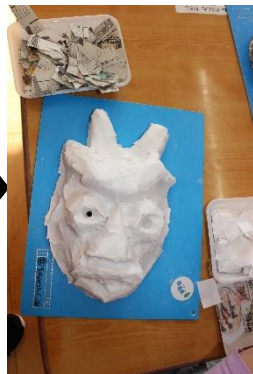
和紙を全体に貼る。