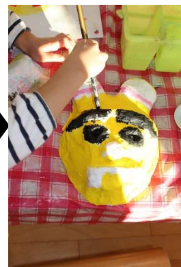
絵の具で丁寧に塗る。